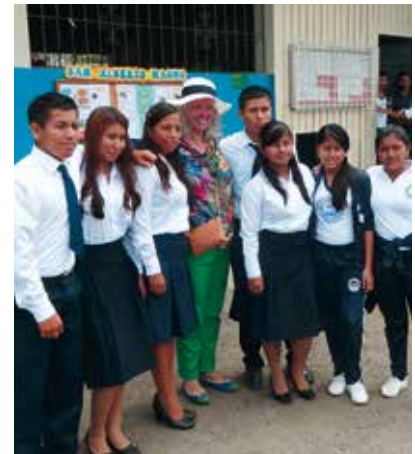
Schulprojekt an der Pazifikküste in Ecuador.