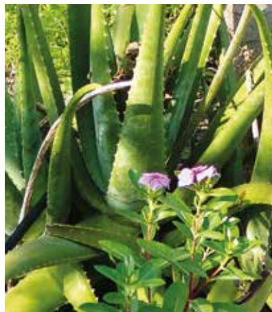
Glückliche Aloe Vera.