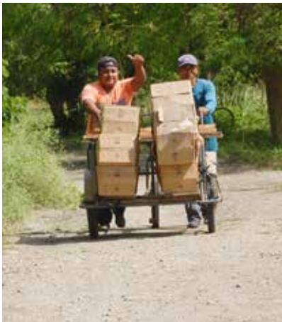
Zusammenarbeit mit Kleinbauern.

Diese positive Energie fließt in unsere Green Luxury Naturprodukte ein. Denn alles ist miteinander verbunden. Wir leben mit und von der Natur. Deshalb ist der Schutz der Umwelt in unserer Unternehmensphilosophie elementar verankert. Seit Firmengründung vor über 35 Jahren tun wir alles dafür, die biologische Vielfalt zu erhalten und auf diese Weise Mensch und Natur zu schützen.