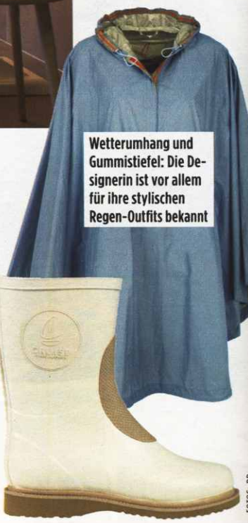
Wetterumhang und Gummistiefel: Die Designerin ist vor allem für ihre stylischen Regen-Outfits bekannt