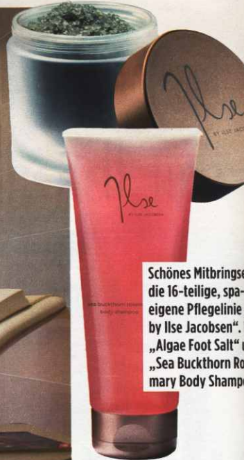
Schönes Mitbringen: die 16-teilige, spa-eigene Pflegelinie „by Ilse Jacobsen“, mit „Algae Foot Salt“ und „Sea Buckthorn Rosemary Body Shampoo“